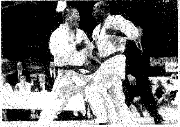
去る10月にドイツで行われたWKF世界大会に団体組手要員として出場。チームは1回戦敗退を喫するものの、日本陣営で唯一の勝ちを収めた。